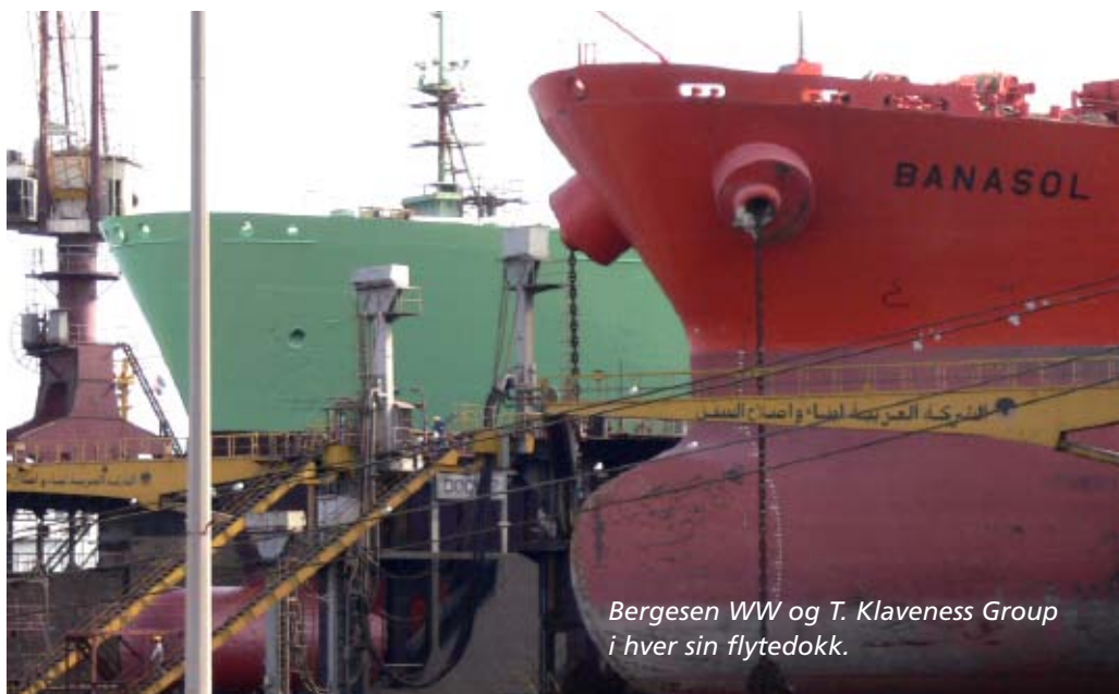
Bergesen WW og T. Klaveness Group i hver sin flytedokk.

Markedet for skipsverft har vært utrolig travelt i år. Når vi snakker med våre verksteder sier alle at dette markedet har de aldri sett maken til.