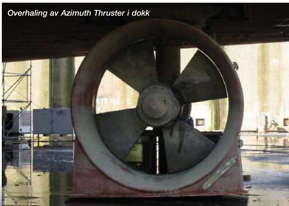
Overhaling av Azimuth Thruster i dokk

Verkstedet er selvfølgelig også klar til å utføre små reparasjoner. Vi har tatt inn båter for rep. av truster afloat (24 timer), rep. av hylsetetninger i dokk (48 timer) etc. Den gamle floskelen "ingen jobb er for liten" gjelder ved Keppel Verolme.